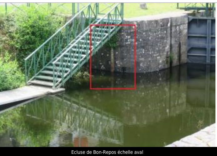
Ecluse de Bon-Repos échelle aval