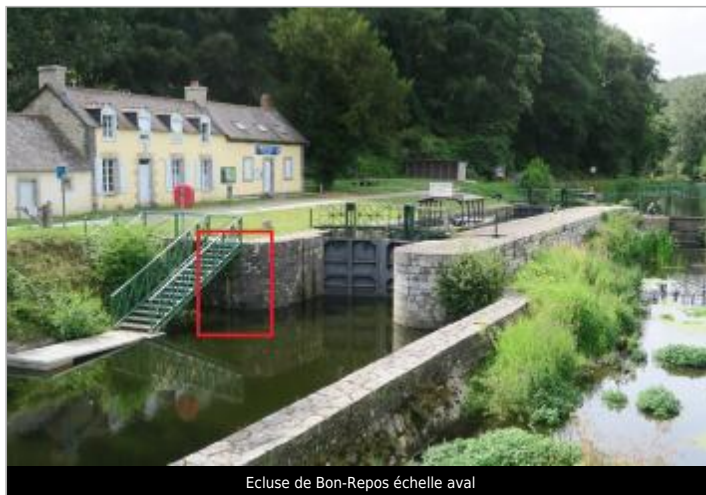
Ecluse de Bon-Repos échelle aval