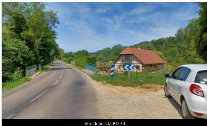
Vue depuis la RD 70.

Coordonnées WGS84 : X: 0.97437632 / Y: 49.84281580