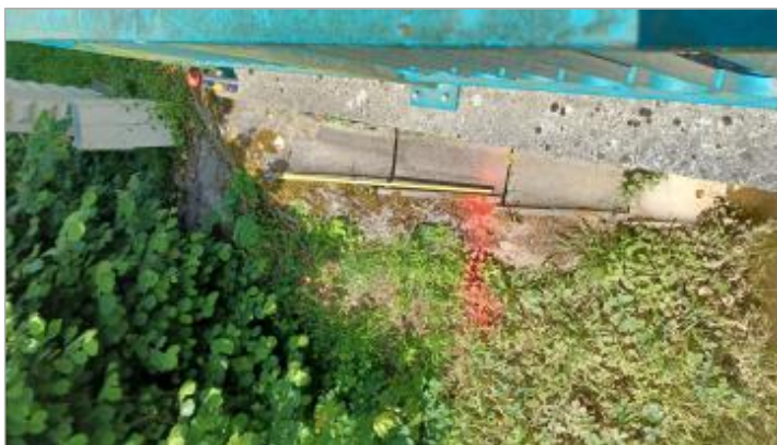
Laisse de crue à 128 cm/haut de la gouttière.

Organisme : SPC Seine aval - Côtiers normands