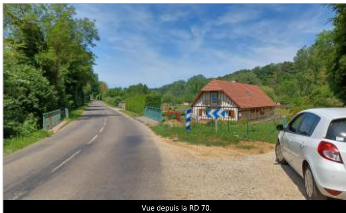
Vue depuis la RD 70.