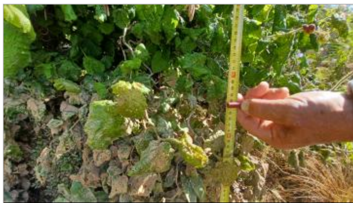
Laisse de crue à 65 cm/sol.

SOURCE DE REPÉRAGE : VISITE DE TERRAIN SPC SACN - 11/03/2020