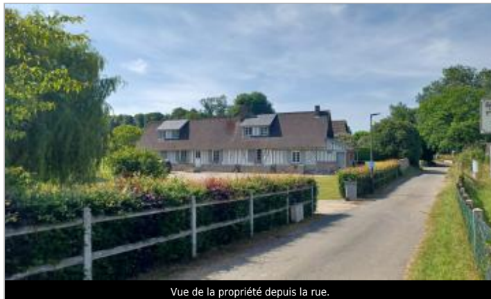
Vue de la propriété depuis la rue.