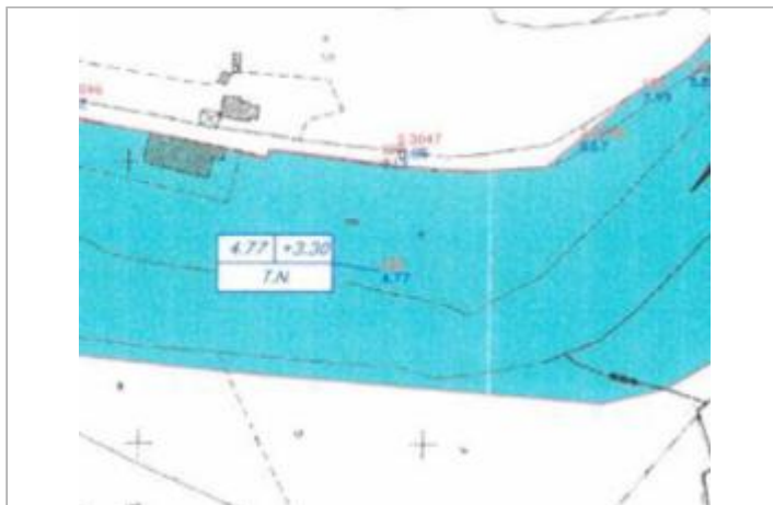
Plan du PPRI des relevés de laisses de la crue de décembre 2000