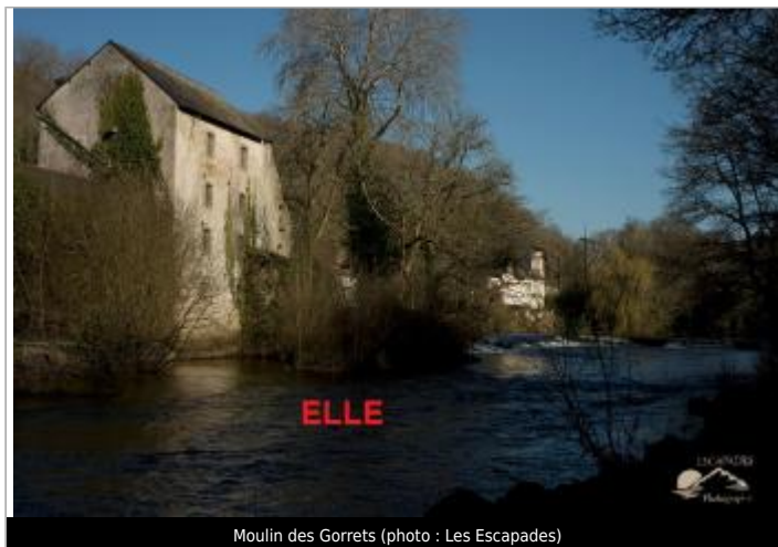
Moulin des Gorrets