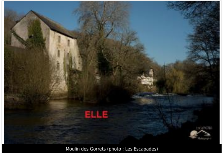
Moulin des Gorrets

Coordonnées WGS84 : X: -3.54056960 / Y: 47.87623020