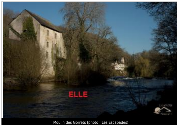
Moulin des Gorrets