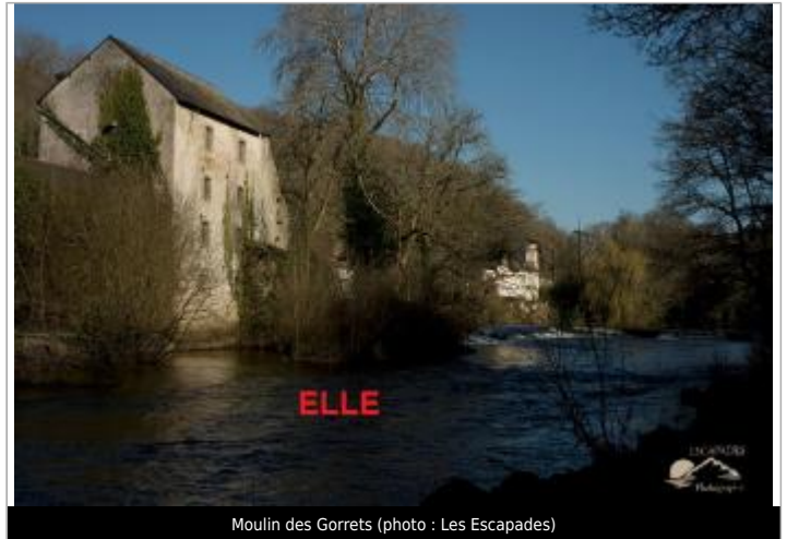
Moulin des Gorrets

Coordonnées WGS84 : X: -3.54056960 / Y: 47.87623020