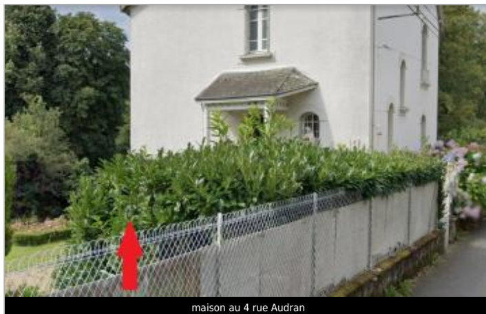
maison au 4 rue Audran