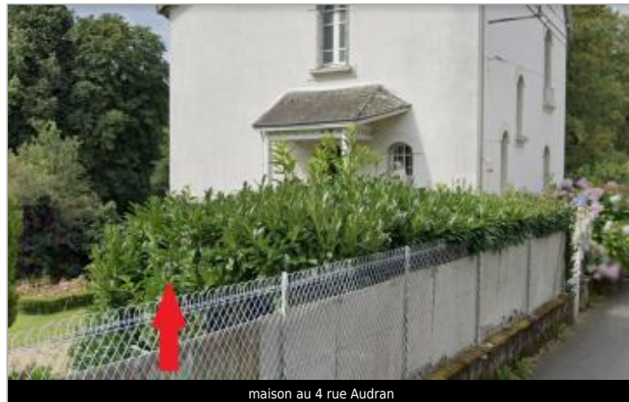
maison au 4 rue Audran

Coordonnées WGS84 : X: -3.54248018 / Y: 47.87656960