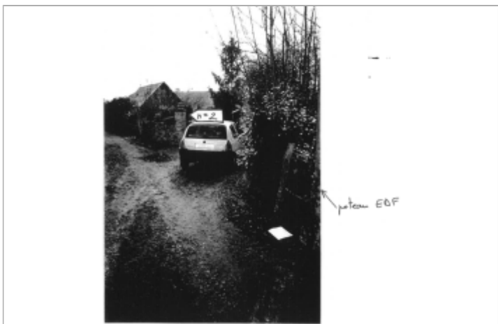
+0.00 TN au niveau du grillage entre le piquet et le poteau EDF