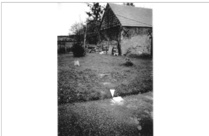
+0.00 marque blanche presque effacée sur le chemin devant la maison