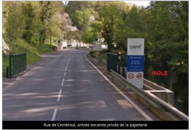
Rue de Combout, entrée enceinte privée de la papeterie