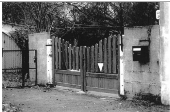
+0.00m dessus du panneau en bois du portail