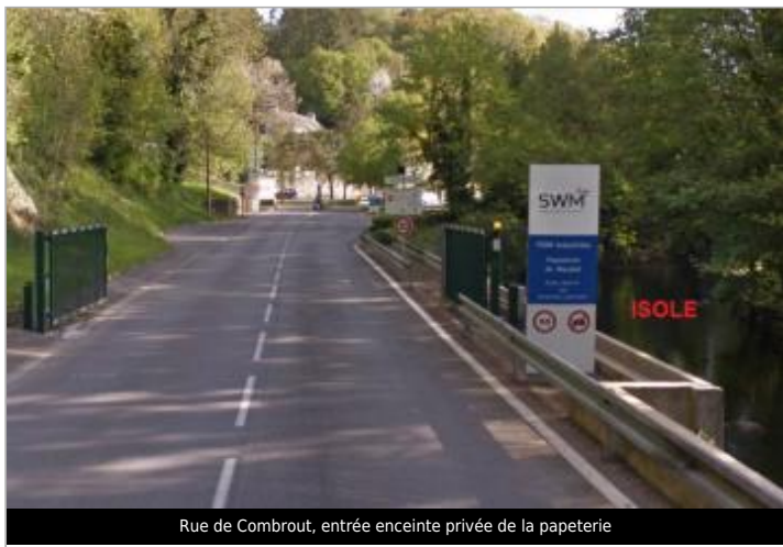
Rue de Combout, entrée enceinte privée de la papeterie

GÉOLOCALISATION Coordonnées WGS84 : X: -3.54522095 / Y: 47.87810420 Coordonnées RGF93 (Lambert 93) X: 211297.46 / Y: 6773344.83 Coordonnées RGF93 (ETRS89) : X: -3.545221 / Y: 47.8781042 Code Hydro: J48-0300 Rive de référence: Droite