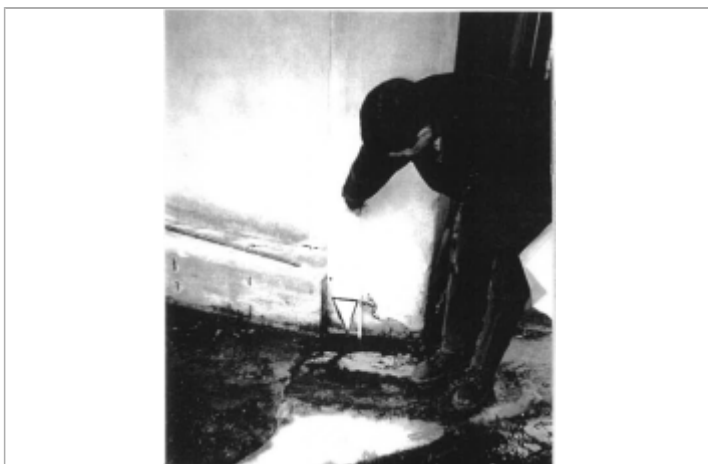
+0,40 m par rapport RNGF