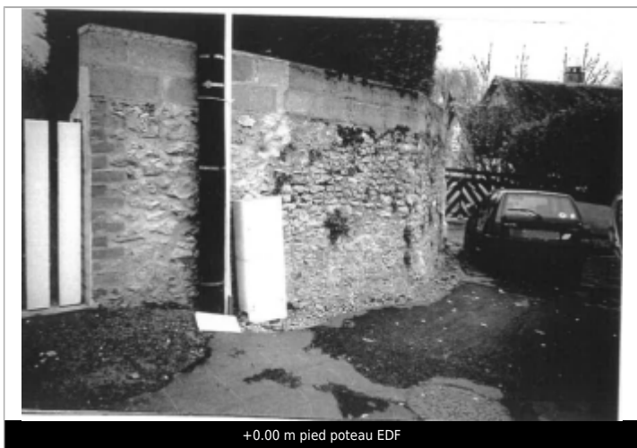
+0.00 m pied poteau EDF

Méthode : GPS Référence nivelée : Marque d'inondation Système altimétrique : NGF IGN 1969 (système normal) Altitude de la référence (en m) : 66.010 m Altitude calculée de l'eau (en m) : 66.01 m