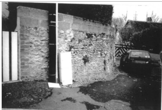
+0.00 m pied poteau EDF

Altitude calculée de l'eau (en m) : 66.01 m