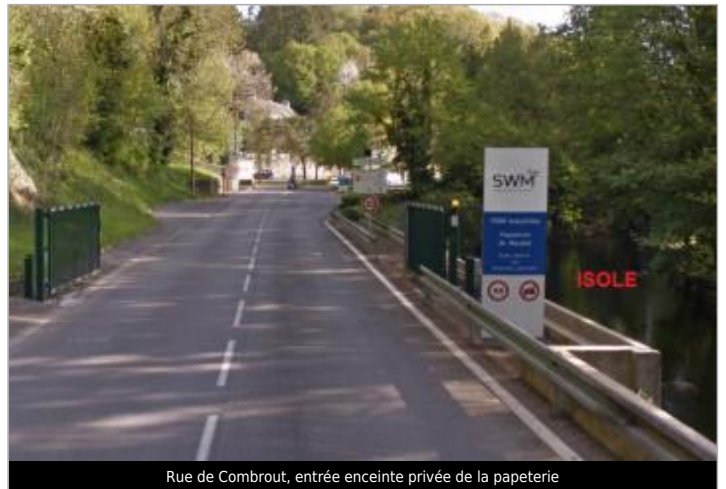
Rue de Combrout, entrée enceinte privée de la papeterie

Coordonnées WGS84 : X: -3.54377345 / Y: 47.87867040