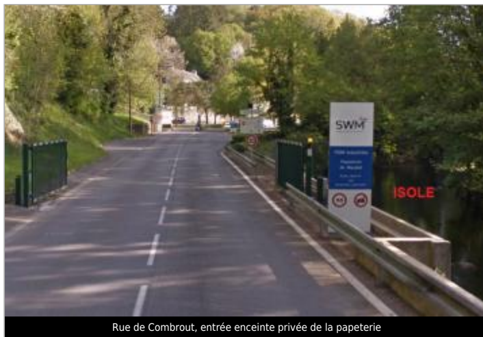
Rue de Combout, entrée enceinte privée de la papeterie