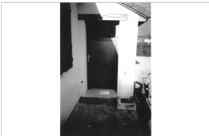
+0.00 m dessus marche béton