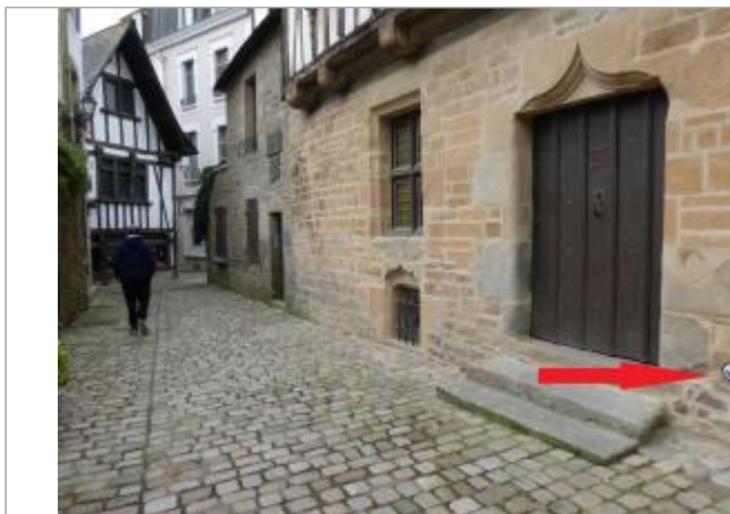
Maison ancienne rue Dom Morice