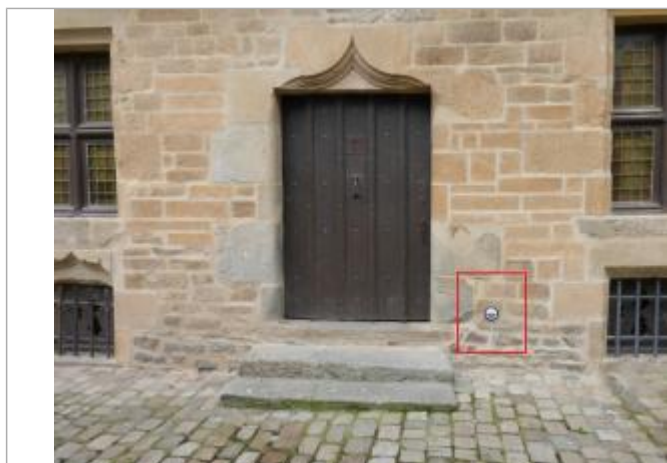
repère normalisé sur le coté des escaliers d'entrée d'une maison ancienne rue Dom Morice