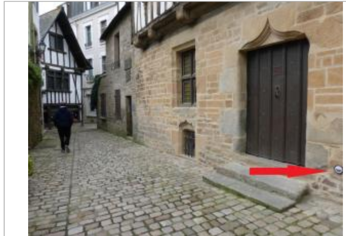
Maison ancienne rue Dom Morice

Coordonnées WGS84 : X: -3.54566781 / Y: 47.87302360