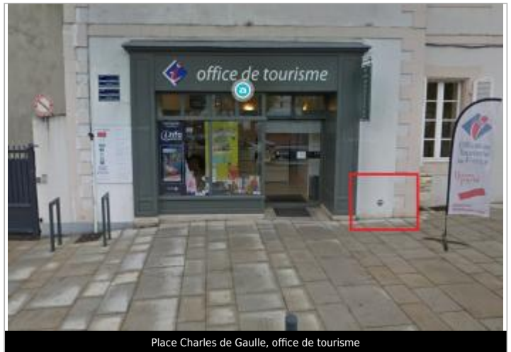
Place Charles de Gaulle, office de tourisme

Coordonnées WGS84 : X: -3.54451509 / Y: 47.87169870