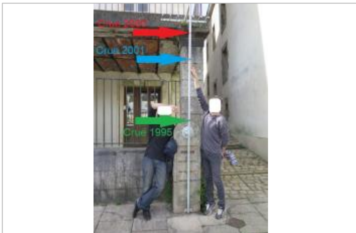
Perche de repères de crues au 9 quai Brizeux