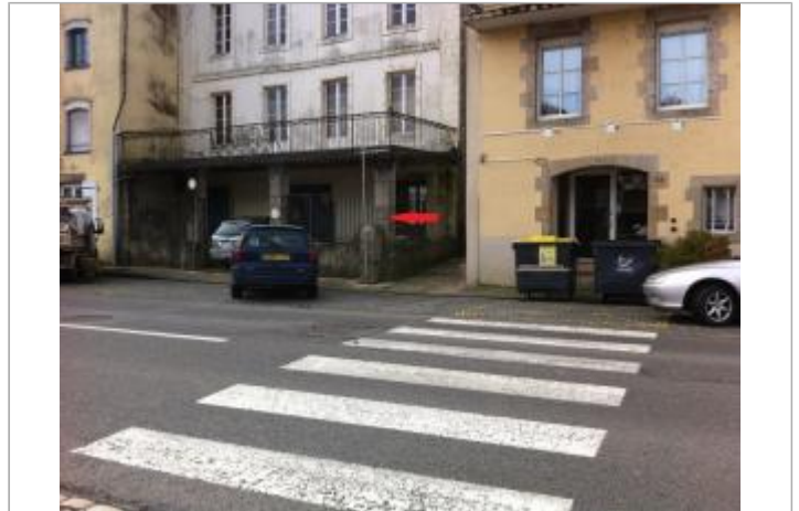
Angle du 9 Quai Brizeux