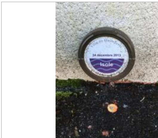
repère de décembre 2013 à l'angle du bâtiment place des anciennes fonderies

Altitude calculée de l'eau (en m) : 6.35