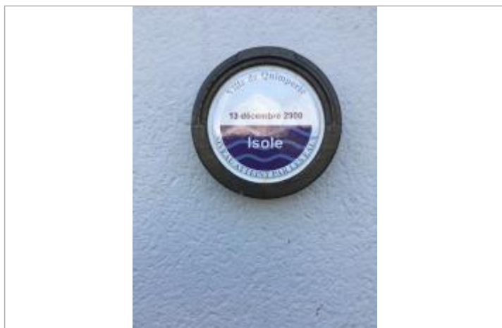
Repère de décembre 2000 à l'angle du bâtiment place des anciennes fonderies

Altitude calculée de l'eau (en m) : 8.03