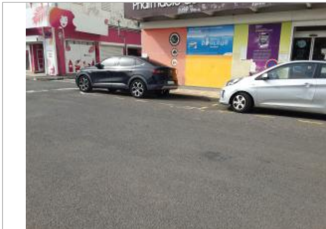
Dépôt de matières solides sur mur extérieur

Coordonnées WGS84 : X: -61.73154670 / Y: 15.99653290