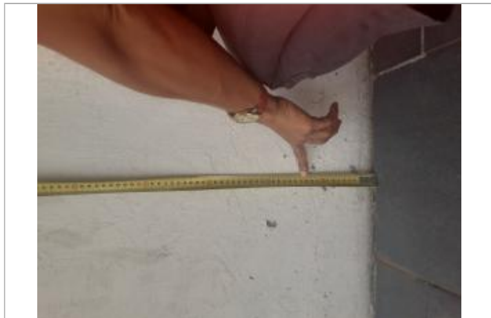
Dépôt de matières solides