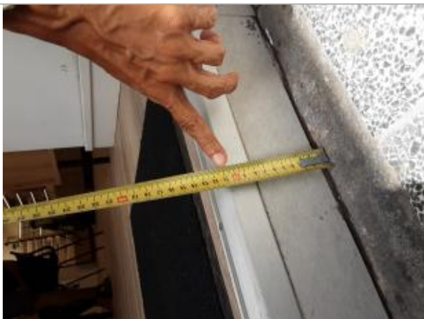
Hauteur minimale atteinte par l'eau