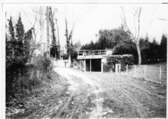
# - Station d'épuration - rive de l'ébé