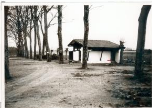
28 - Site sanitaire du Camping