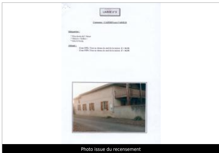
Photo issue du recensement