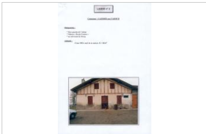
Photo issue du recensement