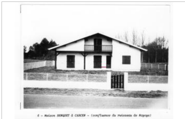
6 - Maison BENQUET à CARZEN - (confluence du ruisseau de Nayoyé)