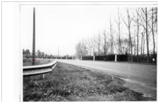
3 - Ollivier de sécurité dans la courbe du CD n° 14