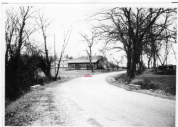
7 - Voie communale n° 2 en allant à TARTAS - Maison BOUQUET (cartes de recensement de crues)