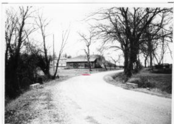
7 - Voie communale n° 2 en allant à TARTAS - Maison BOUQUET (constituée de maisons de Bouquet)