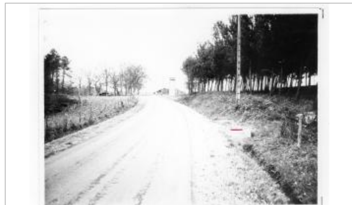
5 - Voie communale n° 3 - Aqueduc à côté du cimetière de CARCEN (coordonnées du réseau de Mirova)

GÉNÉRAL Code : 23_DDTM40_R_231_1 Date de mise à jour : 04/07/2023 Auteur : SPC GAD