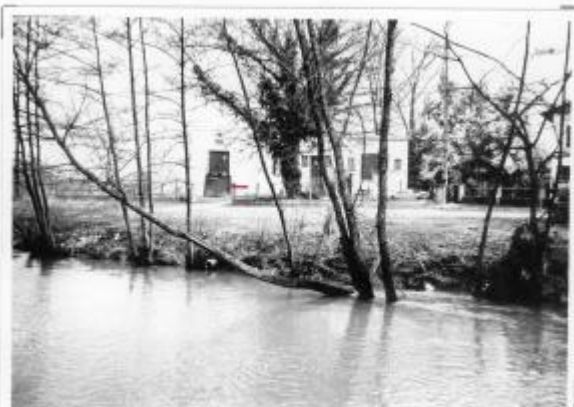
9 - Station de pompage - rive gauche