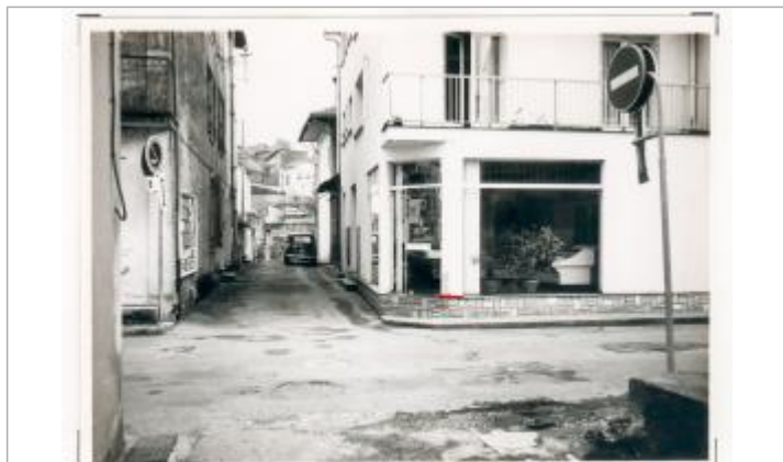
21 - Rue Duprat - Bourgeois LAFFRETSSE