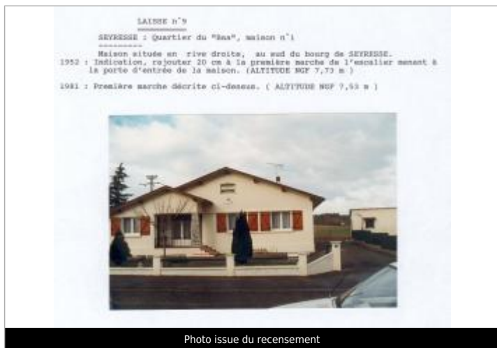
Photo issue du recensement