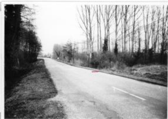
f - CD n° 14 - Pont de Hus