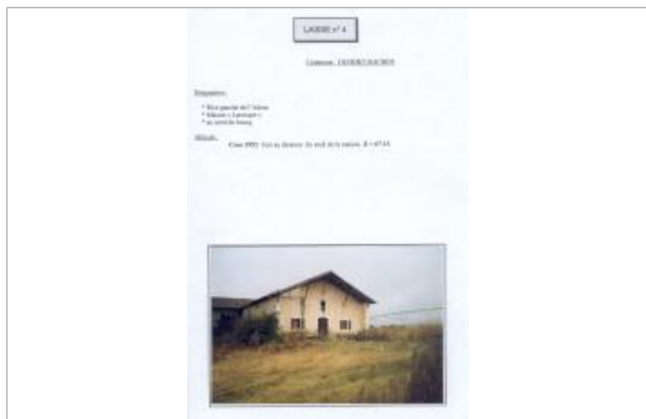
Photo issue du recensement