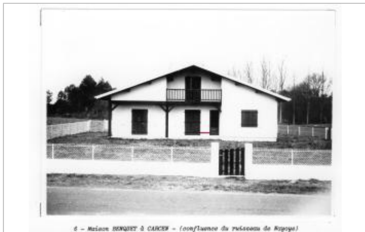
d - Maison BENQUET à CARCEN - (confluence du réseau de Nayoyé)