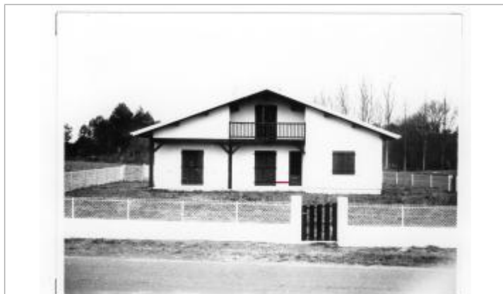
6 - Maison BENQUET à CARCEN - (confluence du ruisseau de Nayoyé)