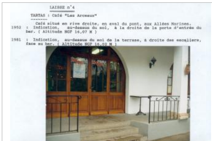
Photo issue du recensement