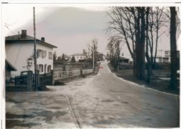
SP - Angle des Allées Marines et place des Arènes