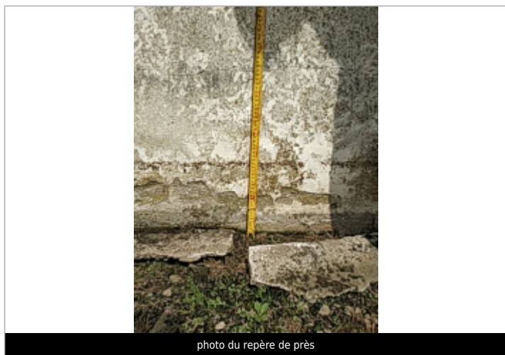
photo du repère de près

Altitude calculée de l'eau (en m) : 240.99 m