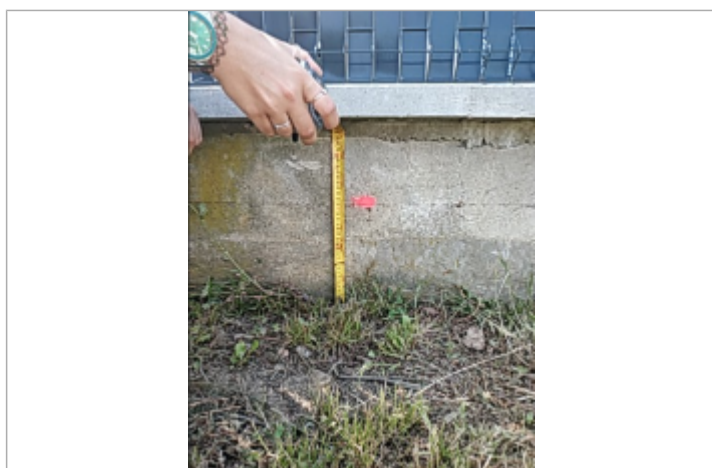
photo du repère de près