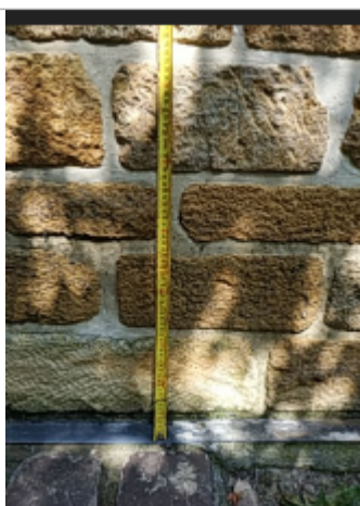
photo du repère de près