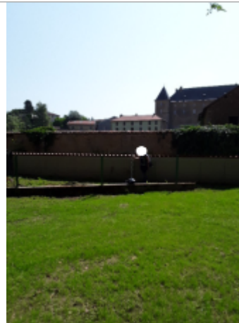
photo du repère de loin