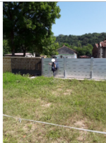
photo du repère de loin