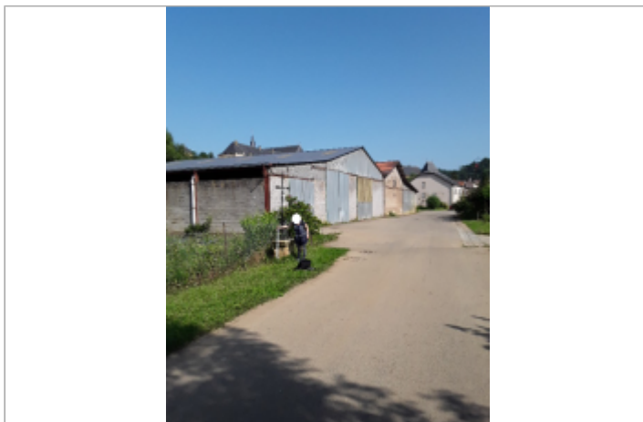
photo du repère de loin