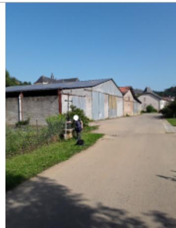
photo du repère de loin

Coordonnées WGS84 : X: 5.70247000 / Y: 49.48160000