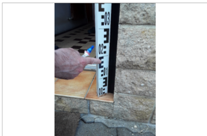
photo du repère de près

Altitude calculée de l'eau (en m) : 196.88 m