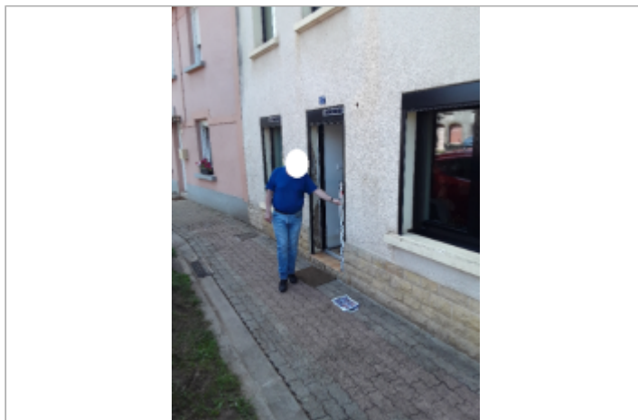
photo du repère de loin