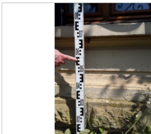
photo du repère de près