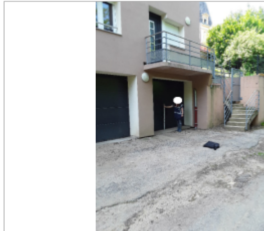
photo du repère de loin

Coordonnées WGS84 : X: 5.75478000 / Y: 49.50389000