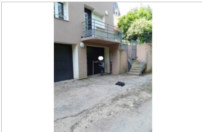
photo du repère de loin